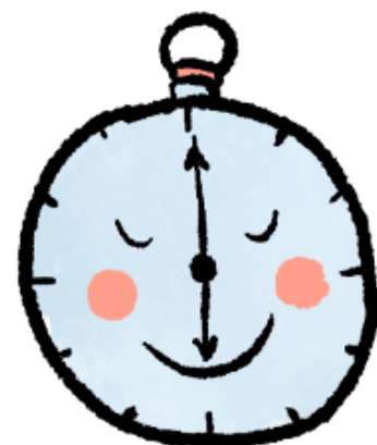
Pidetään kiinni sovituista aikatauluista